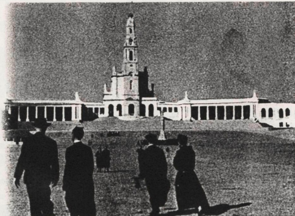
Fatima in Portugal

Es sind schöne Fahrten, die auch von älteren Personen ohne Bedenken mitgemacht werden können.