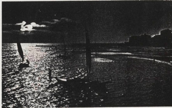
An der Adria

Unübersehbar sind aber die Annehmlichkeiten einer gut organisierten Gesellschaftsreise. – Sie erhalten von uns ein vollständiges Programm und können sich auf eine gute Reise freuen. Sie brauchen sich bei uns um nichts kümmern. Nur solch unbeschwertes Reisen – unter Einhaltung des vorgesehenen Programms – bringt die erholsame Ferienstimmung und das mit großer Vorfreude erwartete, unvergeßlich bleibende Erlebnis.