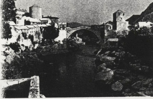
Mostar in Jugoslavien